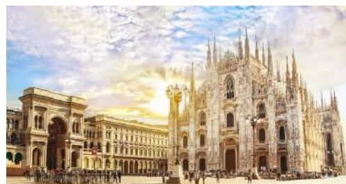
밀라노 SEOUL ..... MILANO