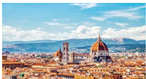
피렌체, 로마 MODENA (BOLOGNA) ..... FIRENZE, ROMA