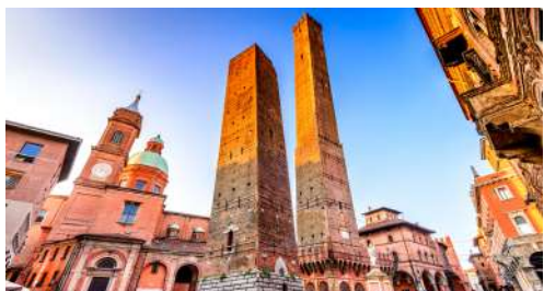
모데나(볼로냐) MILANO ..... MODENA (BOLOGNA)

*파견일정 중 기업 탐방은 2곳 이상 예정이며, 현지 상황에 따라 방문지나 일정이 변동될 수 있습니다.