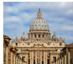
바티칸 성 베드로 대성전

피렌체의 랜드마크이자 보티첼리의 "비너스의 탄생" 등 르네상스 시기 수많은 명화를 보유